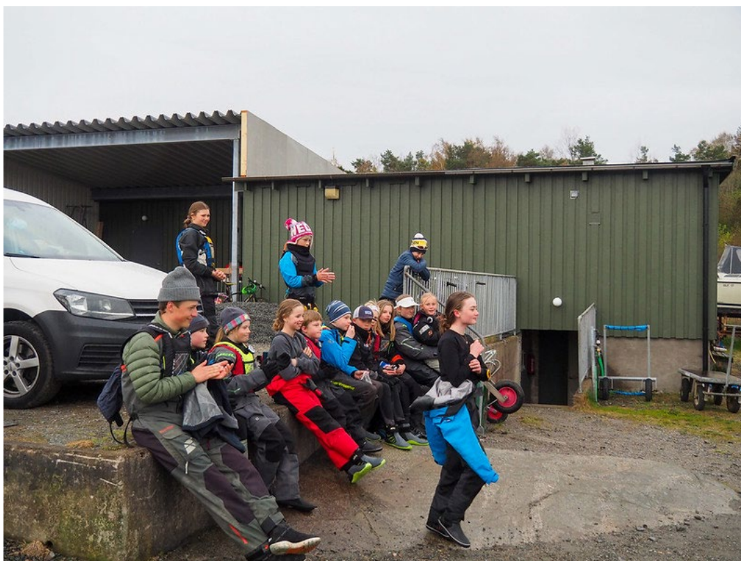
Prisutdelning Torsdagssegling 5/5 21

Ekonomiutskottet har fastställt bokslutet för 2021 samt tagit fram en årsbudget för RÖSS verksamhet under 2022. Övrigt se separat revisionsberättelse från det gångna året.