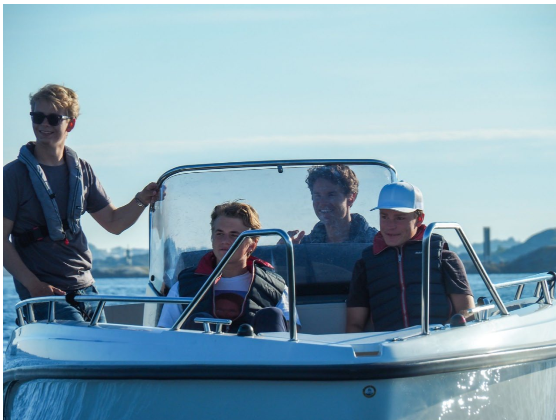
RÖSS tränare som tittar på torsdagssegling